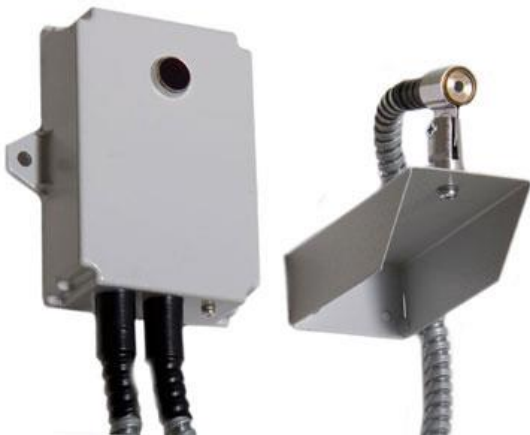
Рис. 1. Извещатель