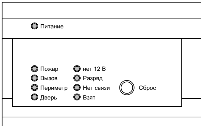
Рисунок 1. Внешний вид приемника (надписи показаны условно)

Приемник имеет 9 индикаторных светодиодов (см. рисунок 1), разделенных по назначению на несколько групп.