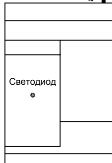
Рис. 1. Внешний вид передатчика

Перед использованием передатчика необходимо установить нужную частотную литеру с помощью джамперных перемычек согласно таблице.