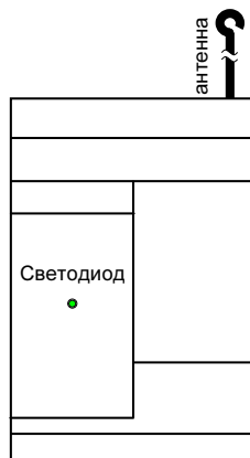
Рис. 1. Внешний вид передатчика

Габаритные размеры: 75 x 120 x 32 мм (без антенны)