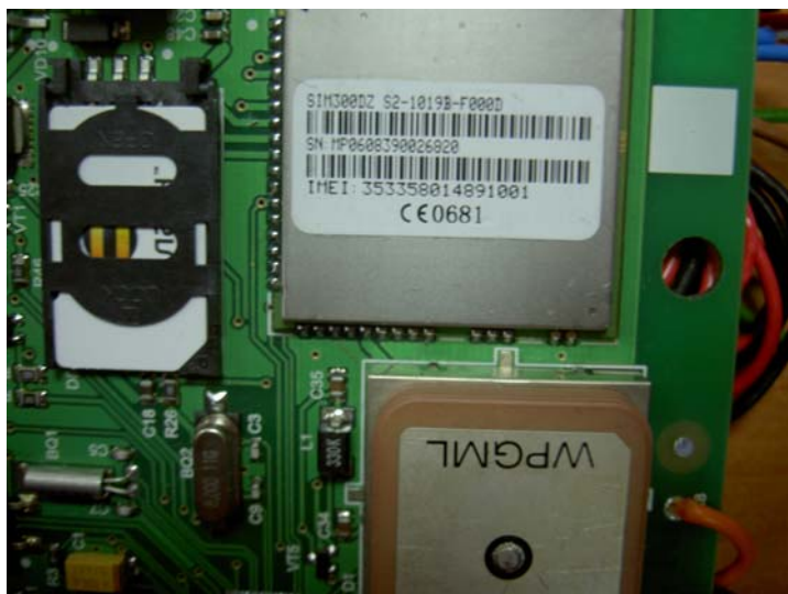
Рисунок 2 Расположение SIM-карты и GSM-модуля

Вывинтить 4 самореза из основания корпуса, отсоединить крышку от основания. Вставить SIM-карту в держатель согласно рис. 2. Вынуть этикетку на клейкой ленте из коробки оператора сотовой связи. Списать IMEI с GSM-модуля на этикетку. Присоединить прибор к источнику питания напряжением 12 В (красный длинный провод – «+», черный длинный – «-»). Светодиод ON засветится красным цветом. Снять питание с прибора. Нажать и держать кнопку, находящуюся слева от SIM-карты, и при нажатой кнопке снова подать питание на прибор. Через 10 секунд отпустить кнопку, снять питание. Соединить основание и крышку корпуса 4 саморезами. Наклеить этикетку на основание, рядом с заводской.