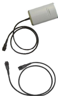
Scorpion Блок питания SCORP 50