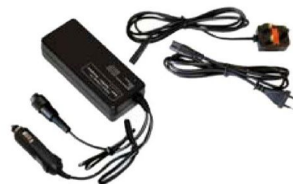
Универсальное зарядное устройство Solo для быстрой зарядки аккумулятора SOLO 726