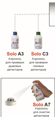
Solo A3 Аэрозоль для проверки дымовых детекторов