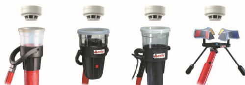
Solo 330 Аэрозольный распылитель