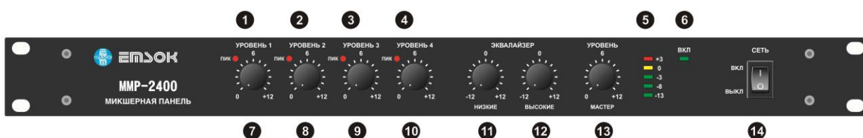
Рис. 1. Передняя панель МП. 1, 2, 3, 4 – индикаторы пикового уровня сигнала, 5 – индикатор уровня выходного сигнала, 6 – индикатор включения, 7, 8, 9, 10 – регуляторы уровня сигнала входов, 11 – регулятор уровня низких частот, 12 – регулятор уровня высоких частот, 13 – регулятор уровня выходного сигнала, 14 – выключатель питания.

На передней панели (рис. 1) МП расположены органы управления и индикации: