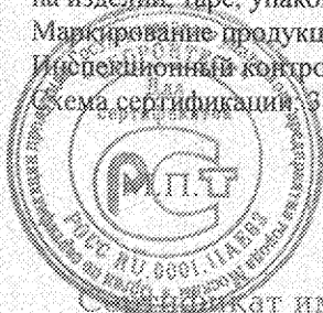
Схема сертификации: С.

Исключительный контроль в декабре 2013, 2014 года.