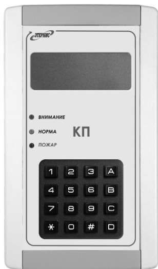
Рис. 1. Внешний вид «КП»

4.2. Внешний вид Изделия приведён на рис. 1, а внешний вид кронштейна крепления, с помощью которого изделие устанавливается на стене помещения – на рис. 2.