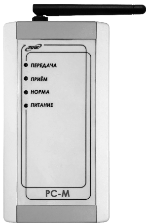
Рис. 1. Внешний вид «РС-М»

4.2. Внешний вид «РС-М» приведён на рис. 1, а внешний вид кронштейна крепления, с помощью которого изделие устанавливается на стене помещения – на рис. 2. Расположение, индикаторов, органов управления и разъема питания приведены в Руководстве по эксплуатации АУП «Гарант-Р» ПО-2.