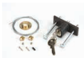
Механизм внешней разблокировки с помощью ключа, для ворот с толщиной полотна более 15 мм, с №1 по №36 (**)