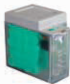
Комплект системы аварийного питания XBAT 24 *