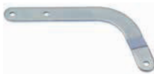
Изогнутый рычаг для секционных ворот