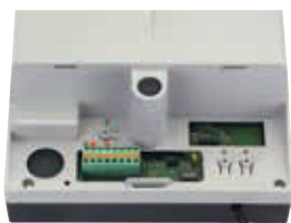
Плата управления E064- E700HS - E1000, встроенная