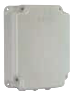
Корпус мод. E для плат управления