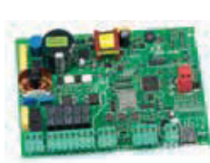
Плата управления E045 Технические характеристики на стр. 135