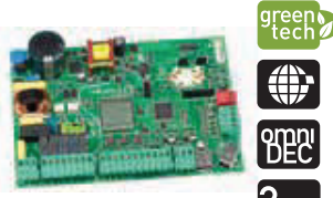
Плата управления E145 Технические характеристики на стр. 136