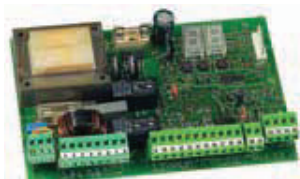
Плата управления 455 D ((пока есть на складе)) Технические характеристики на стр. 134