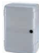
Корпус мод. LM для плат управления