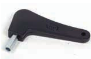
Дополнительный ключ для разблокировки привода