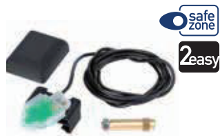
SAFEcoder для приводов 412, 414, 414 long (Патент FAAC)