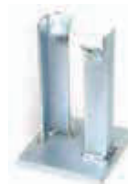
Кронштейн для встроенного в стену монтажа