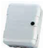
Корпус мод. L для плат управления