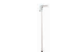
Опорная стойка для прямоугольных стрел