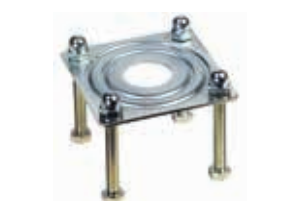
Монтажная пластина для вилочной опоры