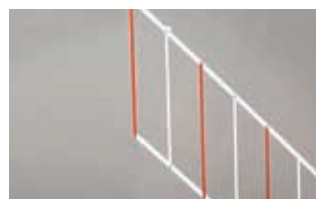
Шторка под стрелу длиной 2 м (только для стандартных прямоугольных стрел) *