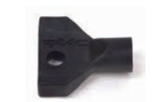
Дополнительный трехгранный ключ для разблокировки привода (в упаковке 10 штук)