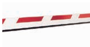
Стандартные прямоугольные стрелы - 5 вариантов длины: