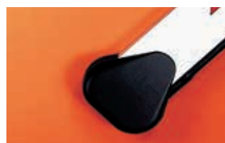
Крепление для прямоугольной стрелы