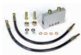
Клапан защиты от вандализма