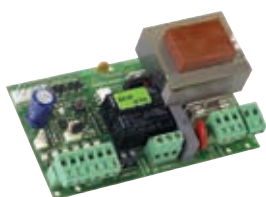
Плата управления 596/615 BPR (встроенная в привод) Технические характеристики на стр. 175