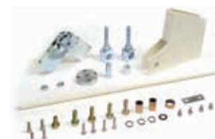
Шарнирный механизм - макс. высота потолка 3 м (только для стандартных прямоугольных стрел)