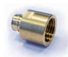
Соединение для оплетки троса RTA