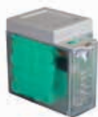
Комплект системы аварийного питания XBAT 24 (не совместим с платой управления E 124)