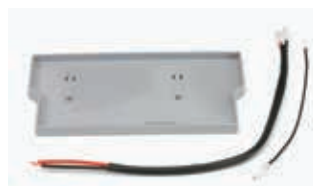
Комплект принадлежностей для системы аварийного питания*** (специально для платы управления E 124)