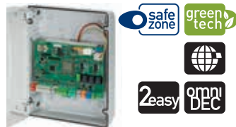
Плата управления E124 с корпусом Технические характеристики на стр. 138