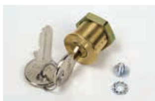
Механизм разблокировки привода индивидуальным ключом