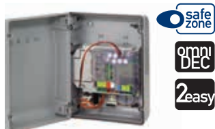
Плата управления E 024S с корпусом Технические характеристики на стр. 137