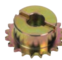
Звездочка Z20 для цепи