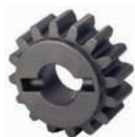
Звездочка Z16 для зубчатой рейки