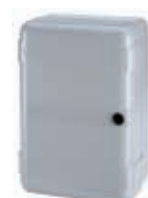
Корпус мод. LM для плат управления