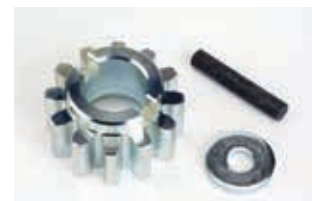
Звездочка Z12 (ворота массой до 2200 кг)