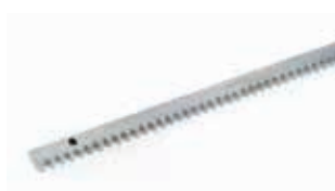
Зубчатая рейка и цепь См. на стр. 68