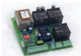
Плата управления 844 T Технические характеристики на стр. 141