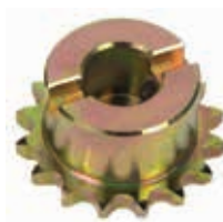
Звездочка Z16 для цепи