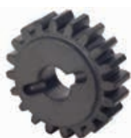
Звездочка Z20 для зубчатой рейки