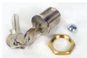
Механизм разблокировки привода индивидуальным ключом