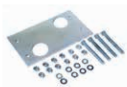
Монтажная пластина с вертикальной и горизонтальной регулировкой положения (в упаковке 6 шт.)