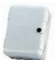
Корпус мод. L для плат управления