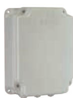
Корпус мод. E для плат управления