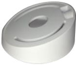
DS-1259ZJ Потолочное крепление