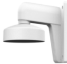
DS-1272ZJ-110 Настенный кронштейн