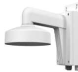
DS-1272ZJ-110B Настенный кронштейн