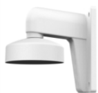
DS-1273ZJ-130-TRL Настенный кронштейн