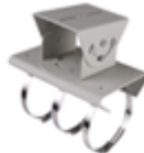
DS-1214ZJ Крепление на столб