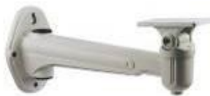
Внутренний/внешний крепёж на стену