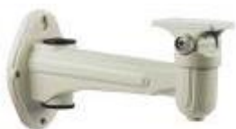
Внутренний крепёж на стену