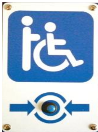
Рисунок 5.1. Радиокнопка вызова КВР-04

Кнопка вызова (рис.5.1) выполнена в виде прямоугольной таблички из ПВХ с нанесенной пиктограммой. Материал корпуса обеспечивает пыле влагостойкой конструкции, соответствующей группе IP-54. В нижней части корпуса имеется влагостойкая кнопка синего цвета. Внутри корпуса расположен радиопередатчик UMB-100H и батарея питания 23А(23АЕ). Кнопка предназначена для накладного монтажа.