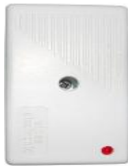
Рисунок 5.2. Радио ретранслятор TRX

Радиоретранслятор TRX служит для увеличения дальности радиоканала между радиокнопками и радиоприёмником (рисунок 5.2). В один радиоретранслятор можно записать коды 112 радиокнопок.