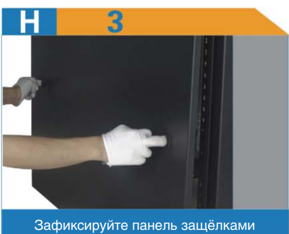
Зафиксируйте панель защёлками