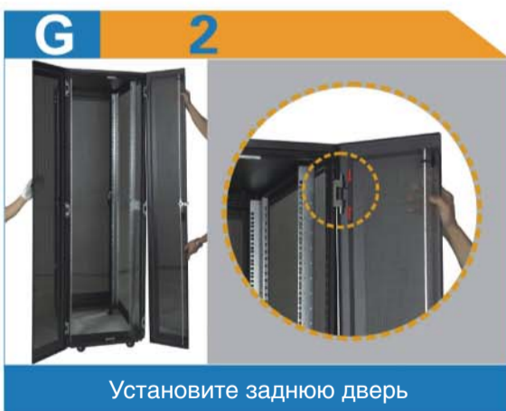
Установите заднюю дверь