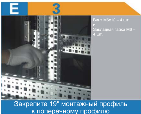
Винт М6х12 – 4 шт. и Закладная гайка М6 – 4 шт. Закрепите 19" монтажный профиль к поперечному профилю