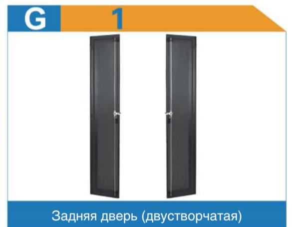
Задняя дверь (двустворчатая)