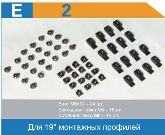
Для 19" монтажных профилей