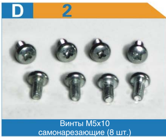
Винты М5х10 самонарезающие (8 шт.)