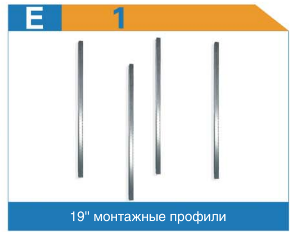
19" монтажные профили