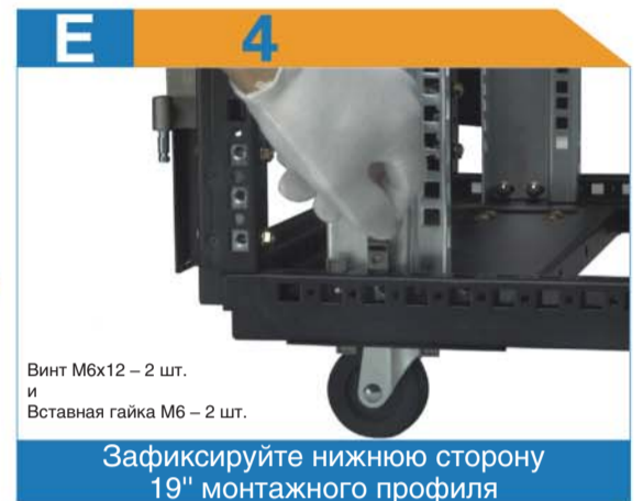
Винт М6х12 – 2 шт. и Вставная гайка М6 – 2 шт.