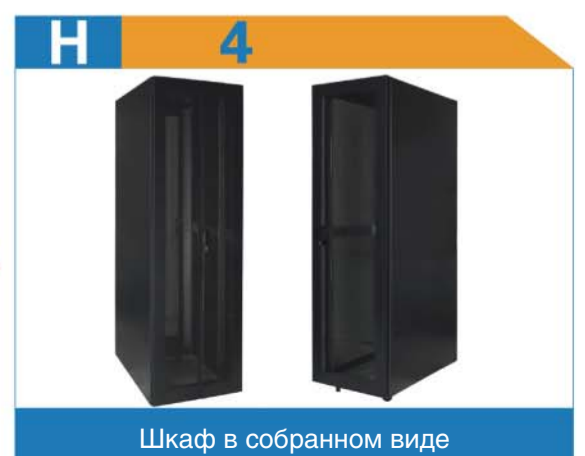
Шкаф в собранном виде