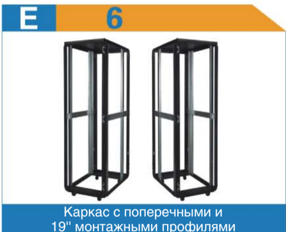
Каркас с поперечными и 19" монтажными профилями