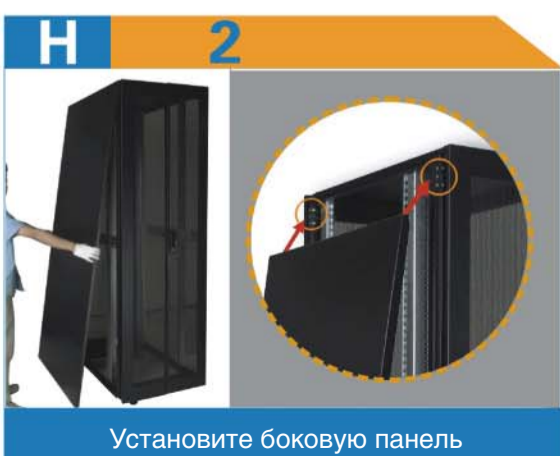
Установите боковую панель