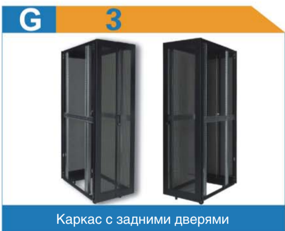
Каркас с задними дверями