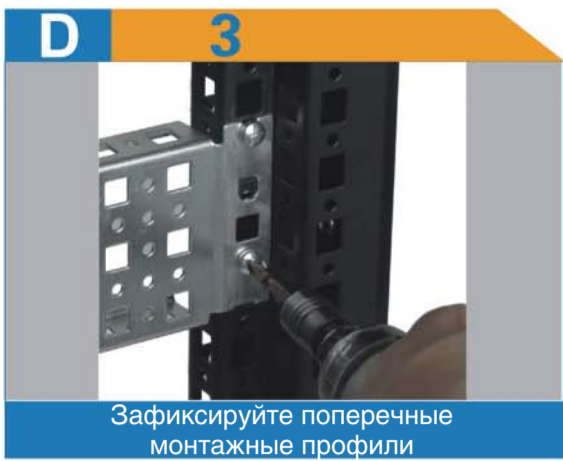
Зафиксируйте поперечные монтажные профили