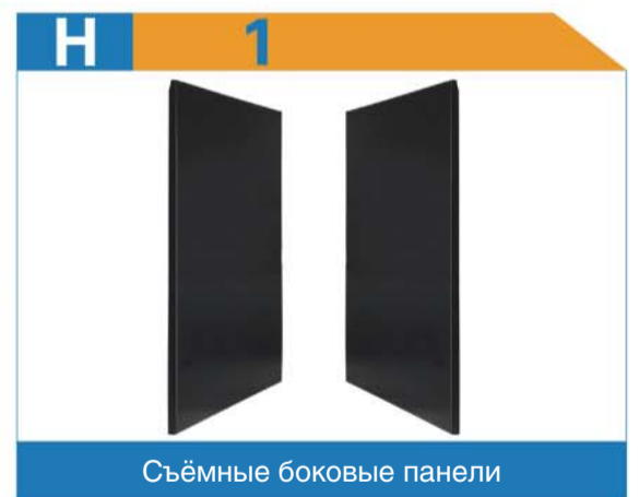
Съёмные боковые панели