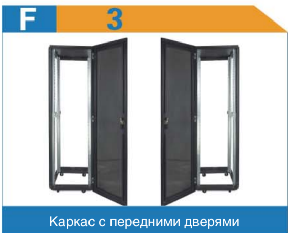
Каркас с передними дверями