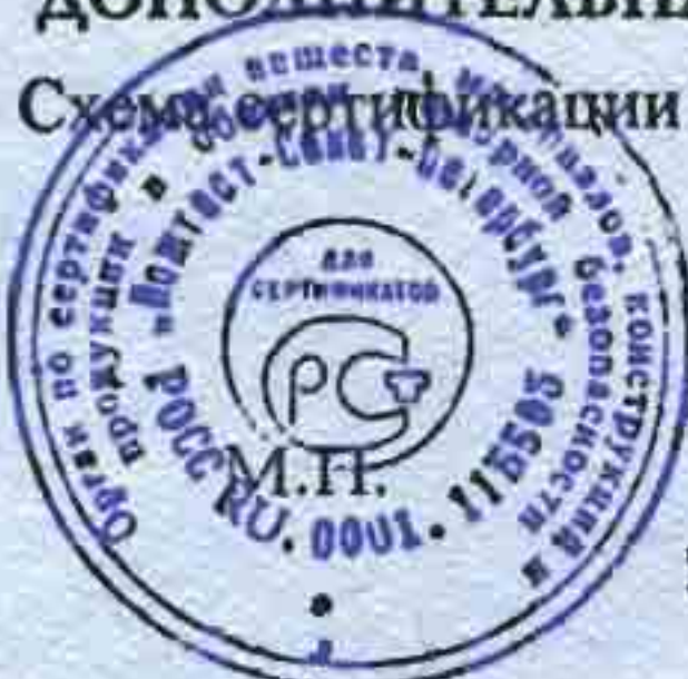
Схема сертификации За