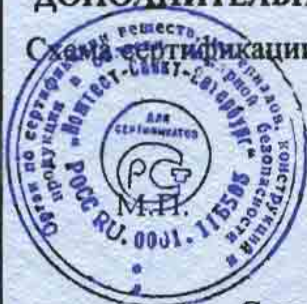
Схема сертификации За