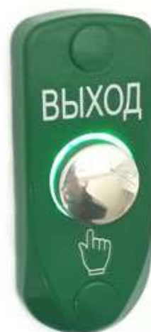
JSB Kn46.1 / JSB Kn46.1-H3