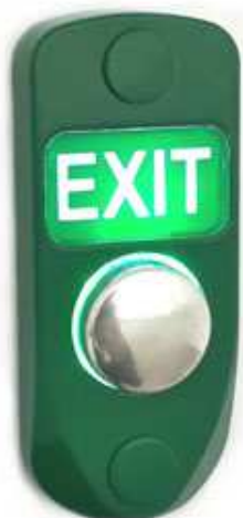
JSB Kn46.0 / JSB Kn46.0-H3