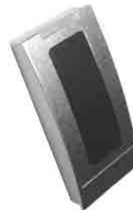
Рисунок 1 – внешний вид считывателя

Считыватель предназначен для приема, обработки и передачи кода бесконтактных электронных кодоносителей стандартов EM-Marin, HID и Temic в линию связи с управляющими устройствами серии «КОДОС» (например, контроллерами «КОДОС ЕС-202», «КОДОС РС-102», ППКОП «КОДОС А-20», и др.) и управляющими устройствами, работающими по протоколу «WIEGAND-26».