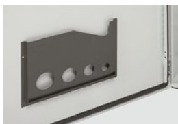
0 365 80