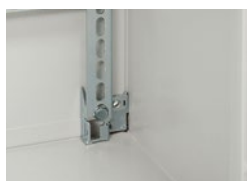
0 361 55