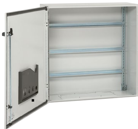
Металлические шкафы Atlantic