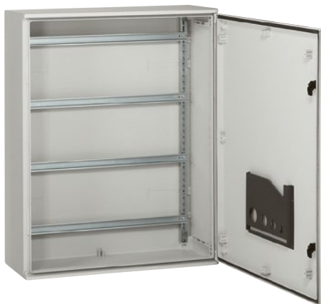
Полиэстеровые шкафы Marina