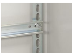
0 367 84 с клипса-гайками 0 364 42 + винты 0 367 75