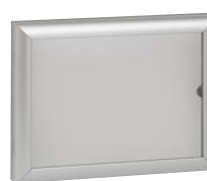
0 475 45