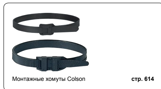
Монтажные хомуты Colson

Для фиксации группы электрических кабелей Неразблокируемые хомуты с внутренними зубцами Соответствуют EN 62275 type 1