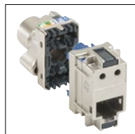
Соединитель Кат. 6 STP экранированный