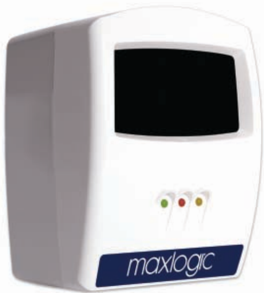
Дымовой линейный извещатель, однокомпонентный