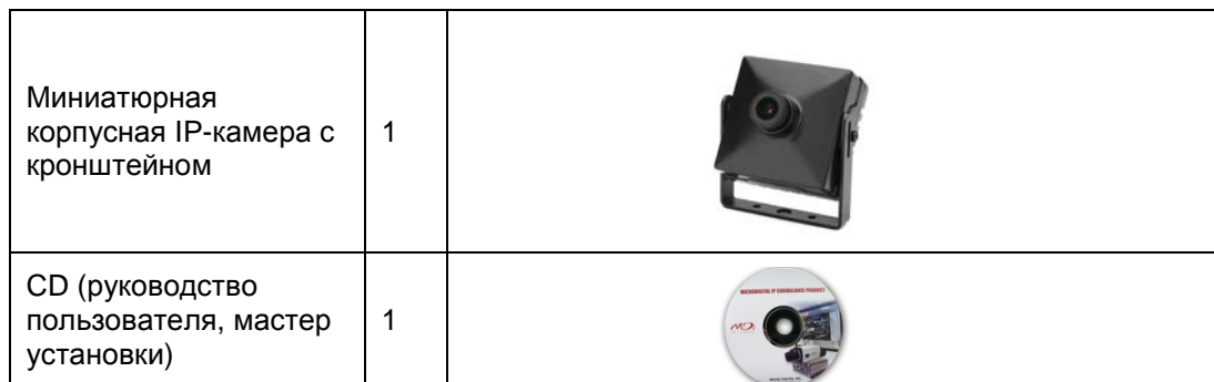
Таблица 2. Комплектация

В комплект входят части, перечисленные ниже.