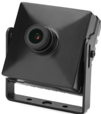
Рисунок 1. Внешний вид

MDC-i3290F миниатюрная корпусная IP-камера для помещений может передавать до 30 кадров/сек с разрешением 1920x1080 по сети, такой как LAN, арендуемая линия, DSL и кабельный модем. Видеоизображение можно просматривать с помощью веб-браузера, если камера подсоединена к сети. Поддерживает одновременное видео сжатие Motion-JPEG и H.264.