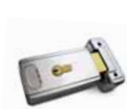
PLA11 Горизонтальный электрозамок 12В (рекомендуется для створок шириной более 3м). 103,50 €