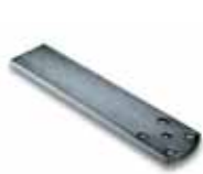
PLA6 Задний кронштейн длиной 250 мм. 9,80 €

Полный ассортимент аксессуаров представлен на страницах 130-141