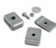
PLA13 Механические упоры крайних положений. 16,40 €