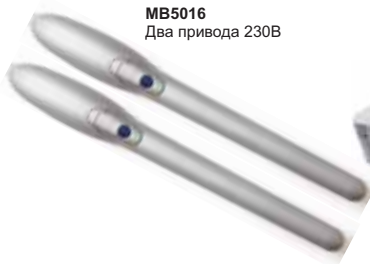
MB5016 Два привода 230В