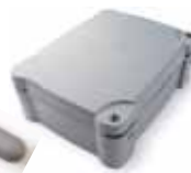
A60/A Блок управления