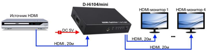
Рис. 3 Схема подключения разветвителя D-Hi104/mini