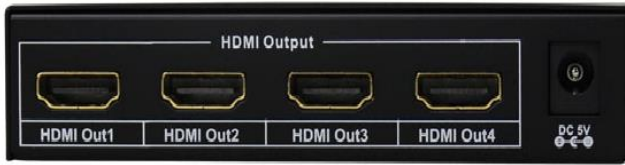
Рис. 2 Разветвитель D-Hi104/mini, вид сзади.