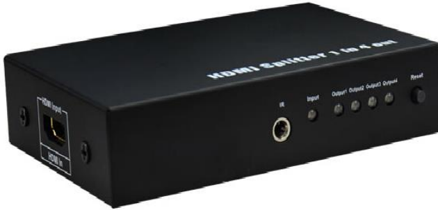
Рис. 1 Разветвитель D-Hi104/mini, вид спереди.