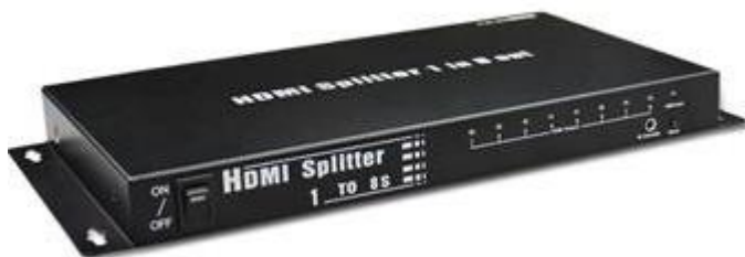
Рис.1 Разветвитель D-Hi108/cascad, вид спереди