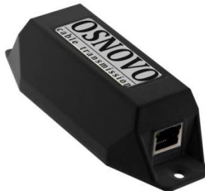
Рис.1 Удлинитель E-PoE/1