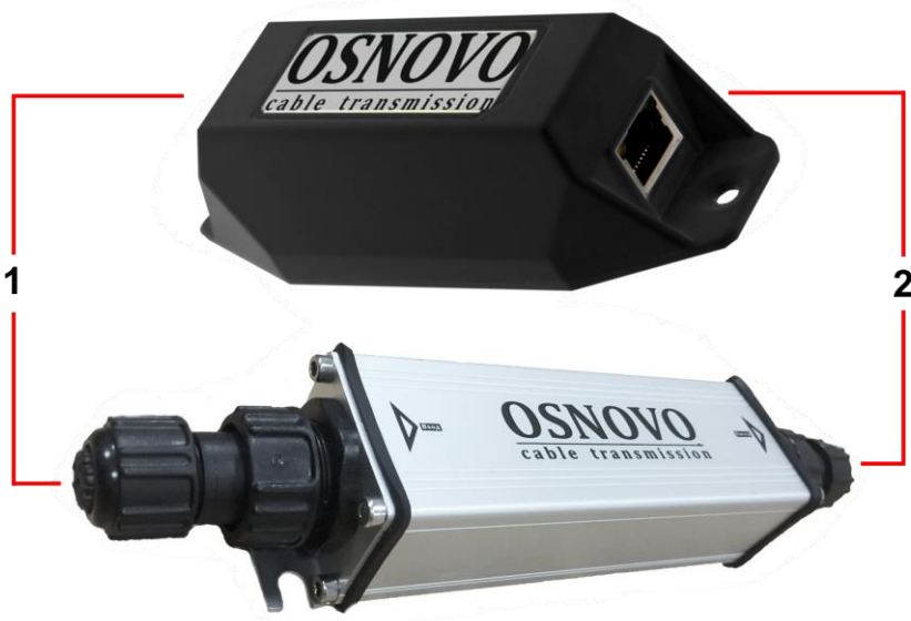
Рис.3 Удлинители E-PoE/1W, E-PoE/1GW, внешний вид