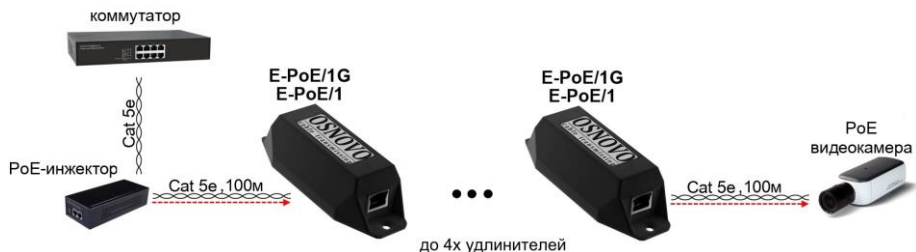
Рис. 6 Схема подключения удлинителей на примере модели E-PoE/1, E-PoE/1G