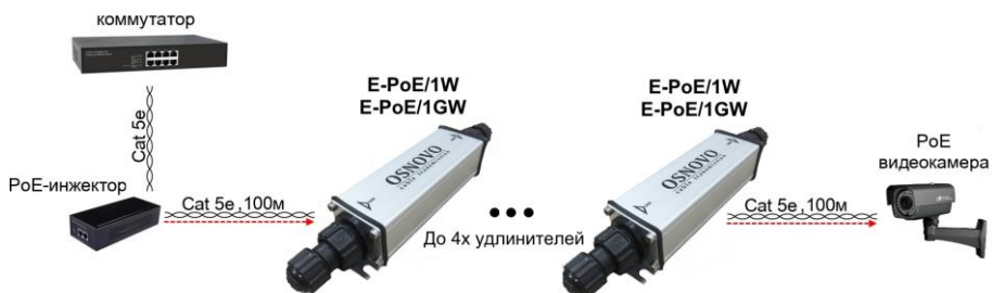
Рис. 7 Схема подключения удлинителей на примере модели E-PoE/1W, E-PoE/1GW