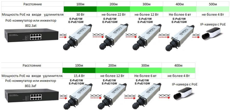
Рис.5 Зависимость передаваемой мощности PoE от расстояния для удлинителей E-PoE/1W, E-PoE/1GW