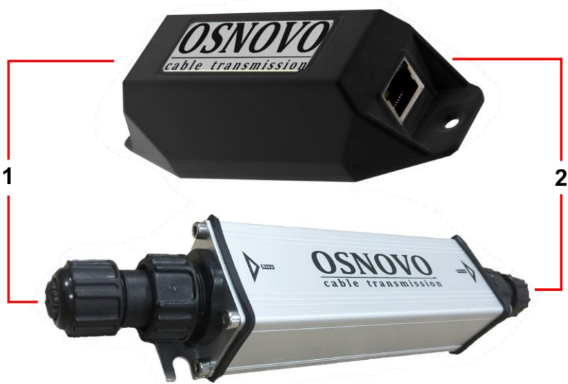
Рис.3 Удлинители E-PoE/1W, E-PoE/1GW, внешний вид