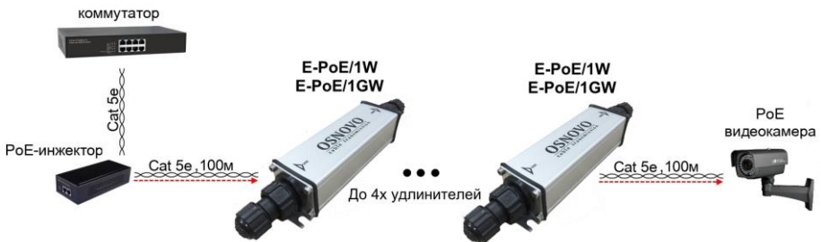
Рис. 7 Схема подключения удлинителей на примере модели E-PoE/1W, E-PoE/1GW