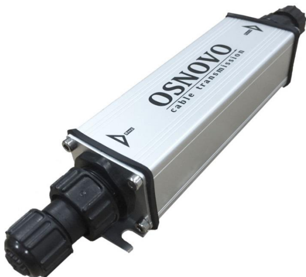
Рис.2 Удлинители E-PoE/1W, E-PoE/1GW, внешний вид