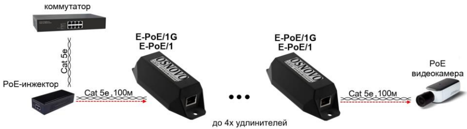
Рис. 6 Схема подключения удлинителей на примере модели E-PoE/1, E-PoE/1G