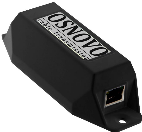
Рис.1 Удлинители E-PoE/1, E-PoE/1G, внешний вид