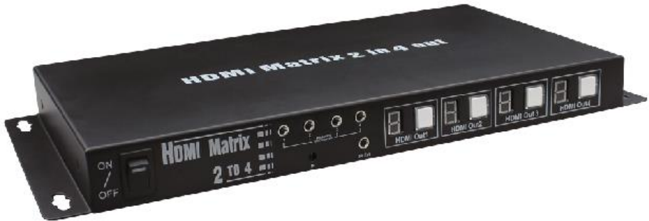
Рис. 1 Коммутатор MX-Hi204, вид спереди.