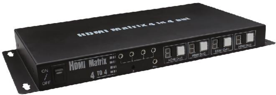
Рис. 1 Коммутатор МХ-Ні404, вид спереди.