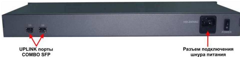
Рис. 3 Коммутатор SW-62422/B (SW-62422/B(400W)), вид сзади