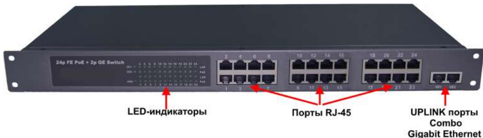
Рис.2 Коммутатор SW-62422/B (SW-62422/B(400W)), вид спереди