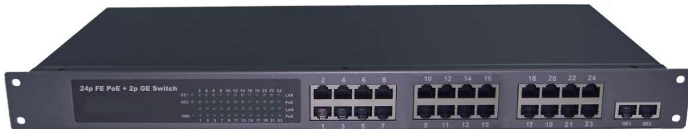
Рис.1 Коммутатор SW-62422/B (SW-62422/B(400W))