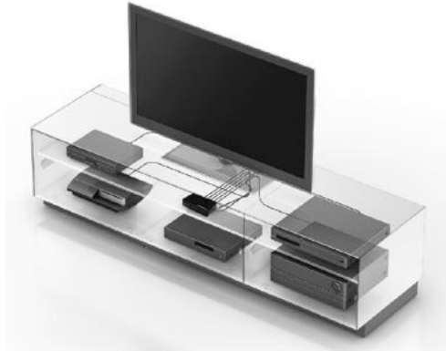
Рис. 3 Пример подключения устройства SW-Hi301