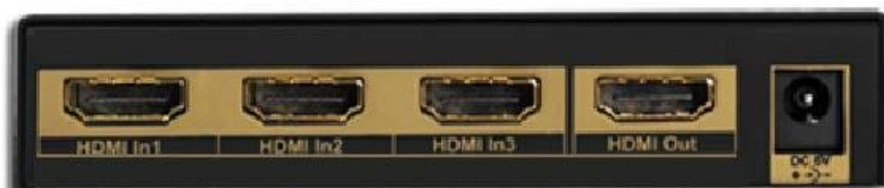
Рис. 2 Коммутатор SW-Hi301, вид сзади.