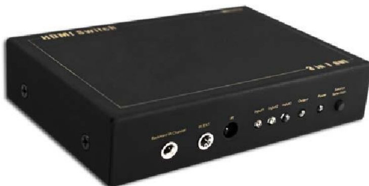
Рис. 1 Коммутатор SW-Hi301, вид спереди.