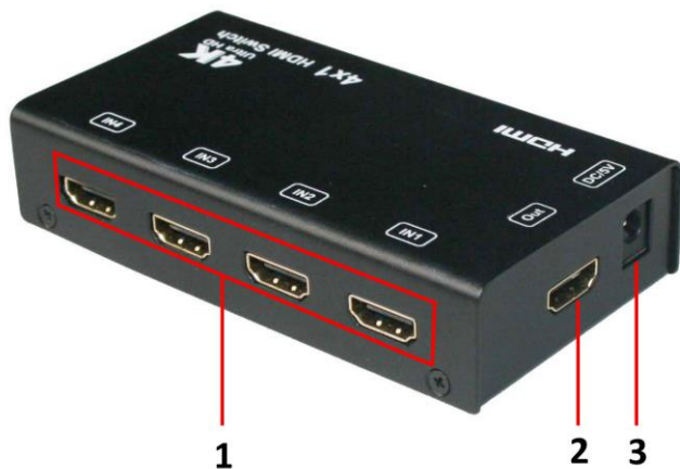
Рис. 3 Коммутатор HDMI SW-Hi401/1, разъемы