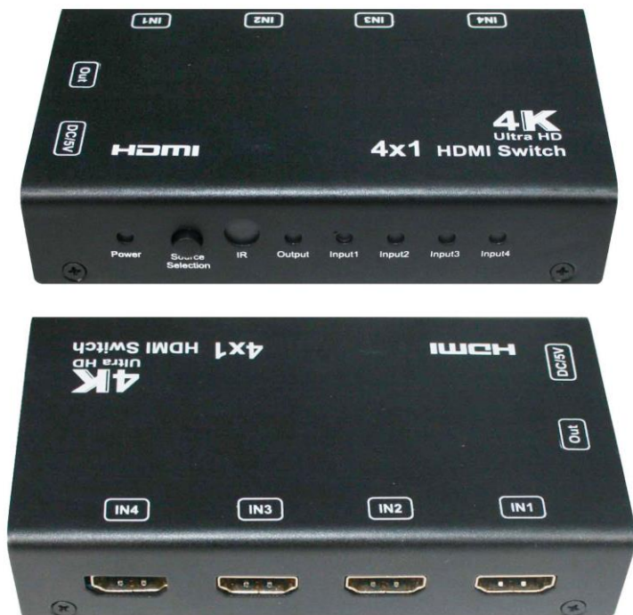
Рис.2 Коммутатор HDMI SW-Hi401/1, вид спереди/сзади