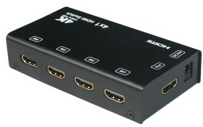
Рис.1 Коммутатор HDMI SW-Hi401/1, внешний вид