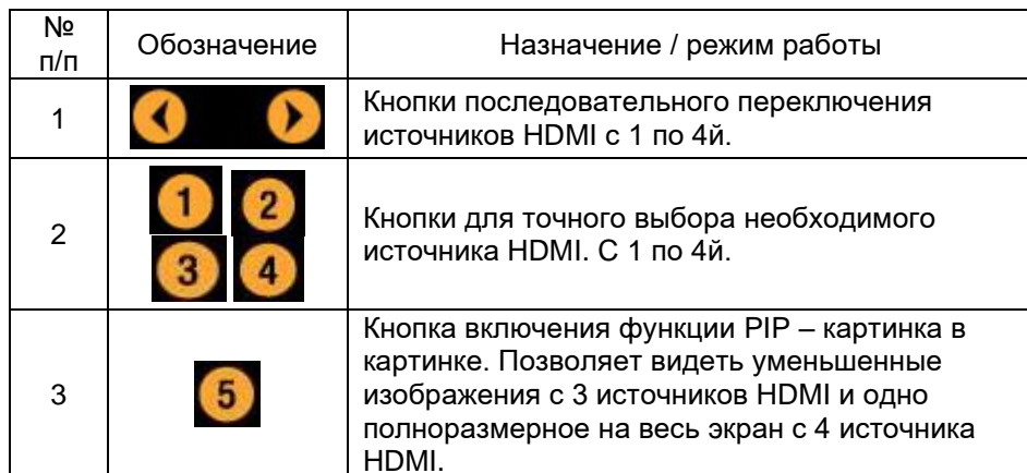
Таб.3 Назначение/режим работы кнопок на ИК-пульте коммутатора HDMI SW-Hi401/1