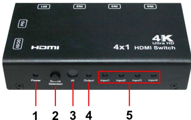
Рис. 4 Коммутатор HDMI SW-Hi401/1, кнопки и индикаторы