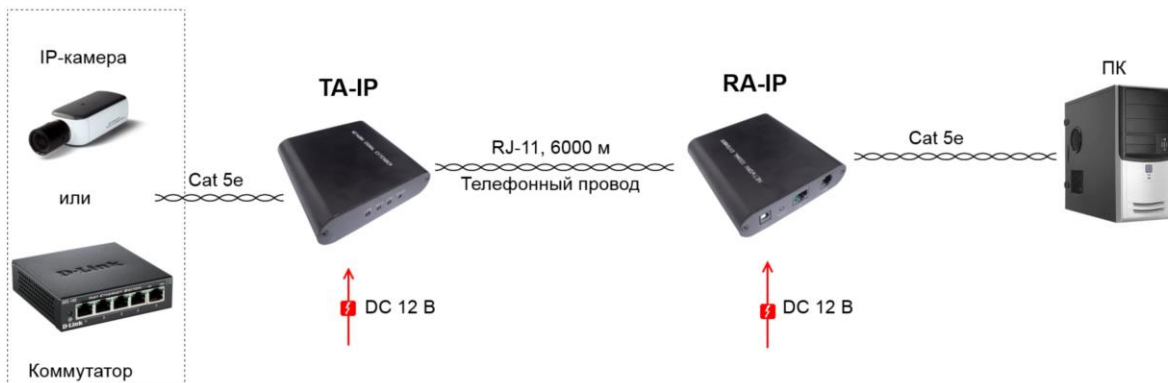
Рис. 3 Схема подключения устройств TA-IP и RA-IP