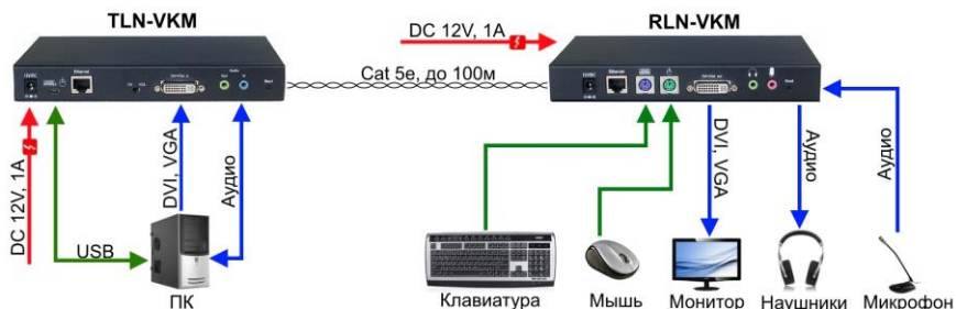
Рис.3 Схема подключения кодера TLN-VKM и декодера RLN-VKM.