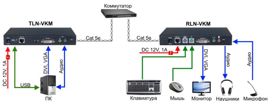
Рис.4 Схема подключения кодера TLN-VKM и декодера RLN-VKM с помощью сетевого коммутатора.