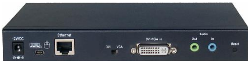
Рис.1 Внешний вид кодера TLN-VKM.