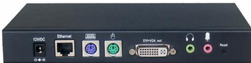
Рис.2 Внешний вид декодера RLN -VKM.