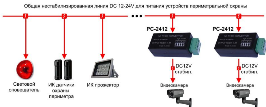
Рис. 4 Схема использования преобразователя PC-2412 в системе охраны периметра