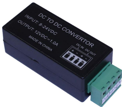
Рис.1 Преобразователь PC-2412, внешний вид