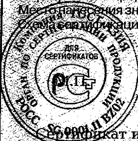
Схема сертификации - З.

Место нанесения знака соответствия на продукцию, на сопроводительной технической документации.