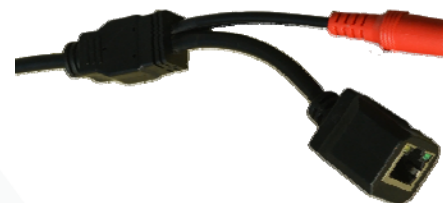
Разъём питания DC 12В