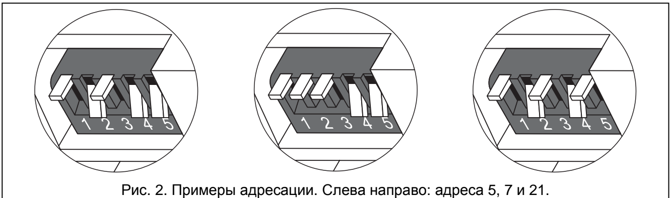
Рис. 2. Примеры адресации. Слева направо: адреса 5, 7 и 21.

Пять переключателей позволяют установить адреса 32 модулям (значения с 0 по 31). Адреса модулей, подключенных к одной шине не могут повторяться, зато очередность адресации произвольная. Рекомендуется всем модулям, подключенным к одной шине, назначать очередные адреса, начиная с нуля. Это позволит избежать проблем при расширении системы.