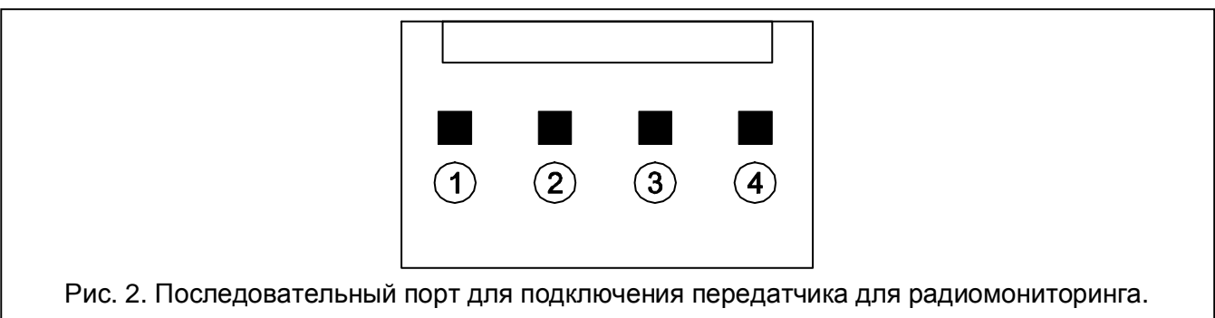
Рис. 2. Последовательный порт для подключения передатчика для радиомониторинга.