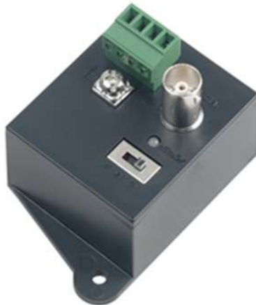
Рис.1 Приёмопередатчик ТТА111TVIT